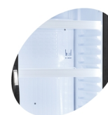
Éclairage LED dans le cadre de la porte